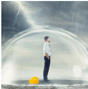
GESTIONE SALUTE SICUREZZA