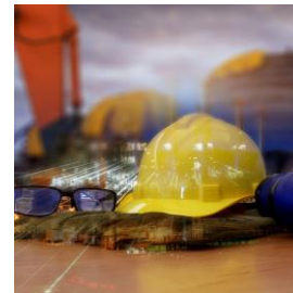
DISPOSITIVI PROTEZIONE INDIVIDUALE