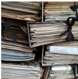
MANSIONARIO INDIVIDUAZIONE RISCHI

GSS è il software per gestire la salute e la sicurezza sul lavoro , ideato e costantemente aggiornato secondo le normative per essere la soluzione ai problemi quotidiani che HSE/RSPP si trovano a dover affrontare. Intuitivo e facile da utilizzare. Tutti i dati contenuti sono condivisibili tra i vari moduli.