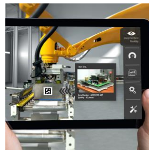
VISUAL INSPECTION AR