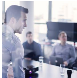
CORSI DI FORMAZIONE