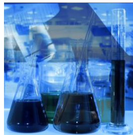
RICHIESTA INTERNA OMOLOGAZIONE