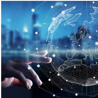
INTERACTIVE SMART COLLABORATION