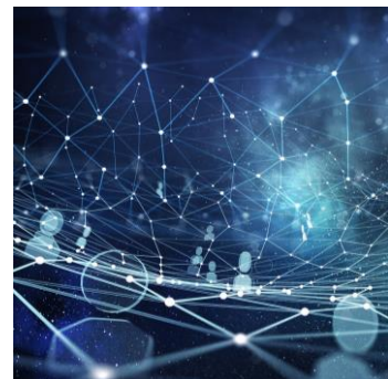
MULTIMEDIA MEETING ROOM