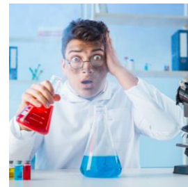
VALUTAZIONE RISCHIO CHIMICO